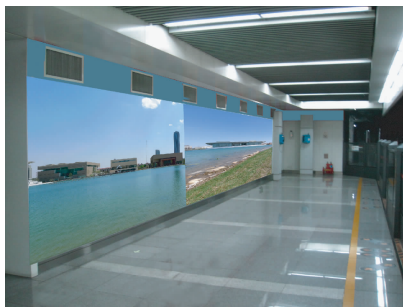
图 10 文化中心站文化墙设计构想

小白楼地区对本地区历史及时尚文化方面的影响,整合周边资源,努力打造天津城市主中心核心交通枢纽。