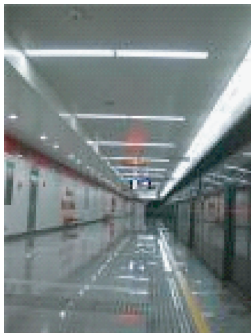
图1 西南角站候车空间

由于年代久远,天津地铁1号线地铁空间设计中文化性表达并不完善,多数地铁站中室内环境装饰单一、简陋,造型呆板。地铁站多采用以灰色为基础色,红色为辅色的空间色彩设计,空间缺乏生气,同时在站台空间设计层面,如空间吊顶、壁面装饰的设计缺乏文化元素渗透 [1] ,如图1~图2所示。