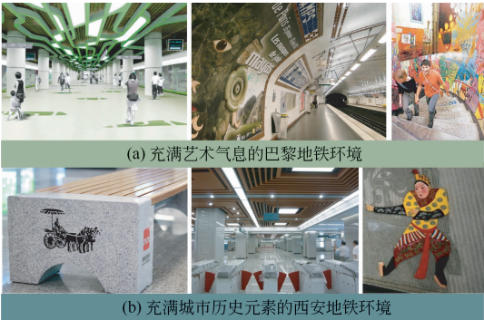
图2 巴黎、西安地铁环境的人文体现

的同质性日益明显,基础设施建设大同小异,缺少城市特色,而城市特色的形成主要依托于城市历史与文化的传承。法国巴黎地铁是世界文化之窗,每个地铁站设计独特,内部装饰各异,成为展示法国文化艺术的窗口;我国西安地铁在承载和表现古城历史文化特色方面做了大量工作,除了车辆装饰体现秦、汉、唐风采外,还在车站内外设置了回形纹、朱雀等具有传统文化意味的标志,特别是在沿途车站设置的46面人文景观墙,综合运用了石材等传统材料,锻铜、不锈钢等现代材料,充分展示了古城的历史沿革和风貌,使乘客在感受现代交通快节奏的同时也能领略古老历史文化的魅力,如图2所示。在提升竞争力的激烈角逐中,以文化软体建设作为突破和引擎是提升城市形象的有效手段。