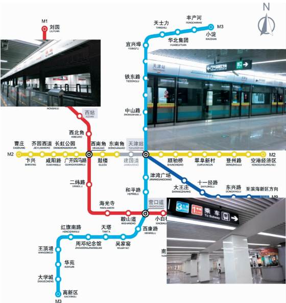
图3 天津地铁天津站、天津西站、营口道站

通过调研几个重要的具备城市窗口功能的轨道交通换乘站(见图3),可以看到,和其他城市相比,天津城市轨道交通环境在体现人文化上还有待深入,在环