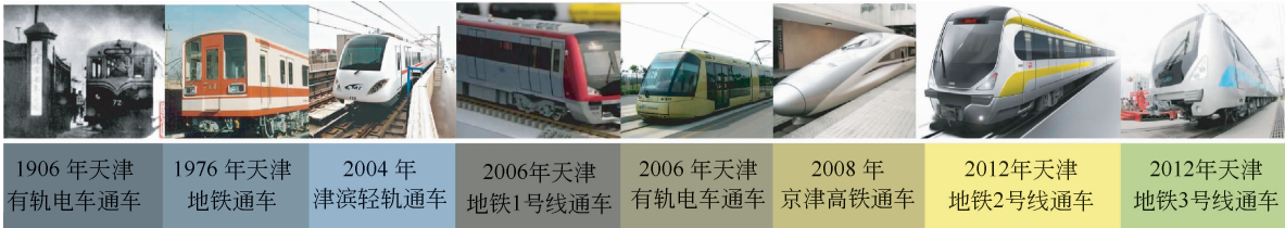
图1 天津轨道交通发展脉络

天津是最早建设轨道交通设施的城市之一,如图1所示。20世纪初,有轨电车技术进入我国,天津市成为继香港之后第二个开通有轨电车的城市;天津地铁始建于1970年4月,至1976年1月,天津地铁先期建设了3.6 km,开通了4个车站试运行,1984年12月加开两站,总里程达到7.4 km,是中国继北京之后第二个拥有地铁的城市 [2] ;2004年,津滨轻轨开通运营;2006年,天津地铁1号线提升改造后通车,同年,导轨电车开通运营;2008年,中国首条高速铁路客运专线——京津高铁开通,这是中国第一条时速300 km以上的城际高速铁路;2012年天津地铁2、3号线相继开通,另有多条轨道交通线路正在建设中。随着滨海新区的快速发展,以及京津同城化,天津正在成长为一个国际化的大都市。经历了600余年的沧海桑田,特别是近代百年,造就了天津中西合璧、古今兼容的独特城市风貌。